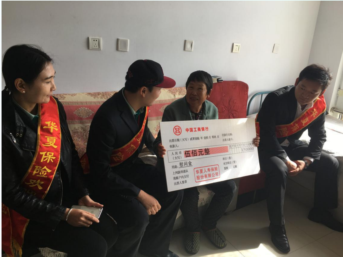
(华夏人寿锡林郭勒中支 青 秀)

让社会能够了解华夏保险，同时以我们最优质的服务回馈客户，用爱搭建桥梁，构建和谐社会，谱写更加辉煌灿烂的新篇章！