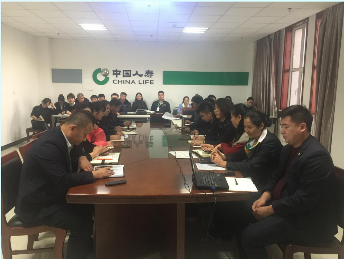
(图文/中国人寿财险锡林郭勒中支 刘海娜)

安排成立三个领导小组，各督导组对各项指标要求进行督导，他强调全员众志成城迎战双11，落实责任险日销售平台建设；最后责任意外险部马占宏经理宣导本次活动方案，在双11的10天活动时间里，要求每人至少销售5单安心驾、安心行或驾乘无忧产品。1单百万安心疗。通过开展双十一营销，提升全体员工销售能力。