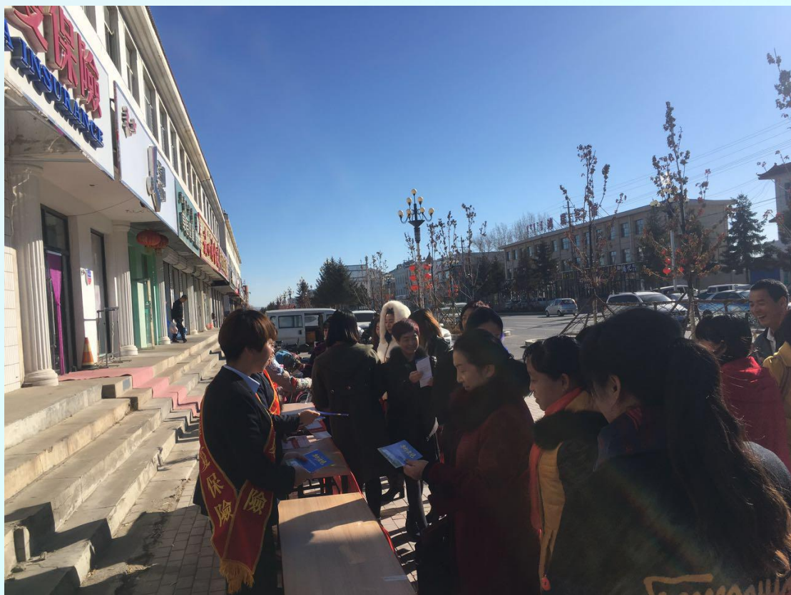
(图文/华夏人寿锡林郭勒中支 申鑫蕊)

了翱翔的翅膀，同时也为各家金融机构带来了严峻的考验，洗钱犯罪活动逐步出现了智能化、隐蔽化的趋势，严重的危害了国家利益、国家安全和金融机构健康有序的运行。因此，打击洗钱犯罪活动，人人有责，我们必须高举反洗钱的旗帜。华夏保险多伦支公司在行动!!!