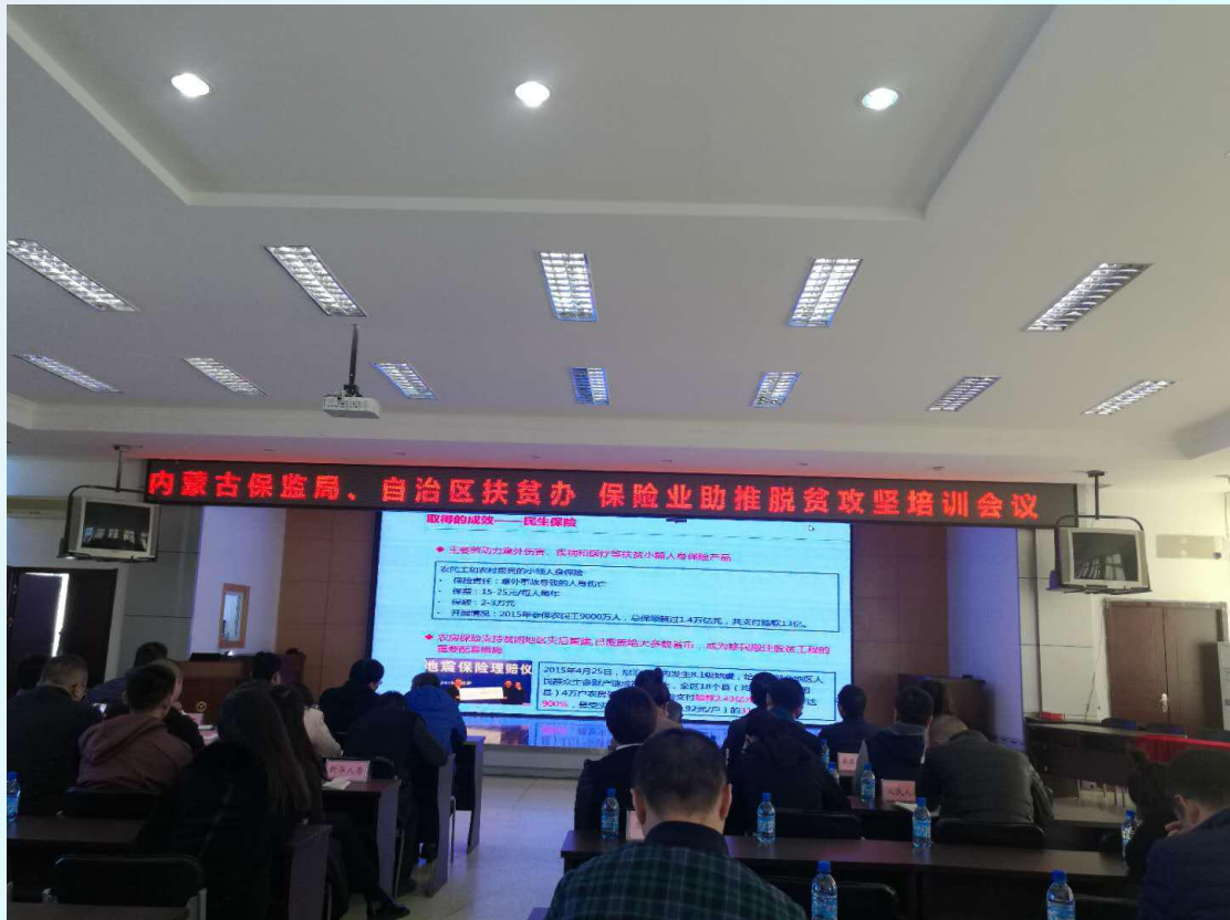
(图文/锡盟行协 王晓丽)