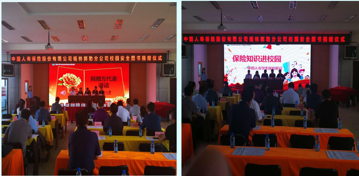
(图文/中国人寿锡林郭勒分公司 王丽)

捐赠仪式上，锡林郭勒分公司团体业务部经理对学生保险业务的保障内容、保障责任、收费标准、办理流程进行了详细的讲解，并通过校园安全图书捐赠活动，将对锡市地区学生险业务开办起到积极的推动作用。