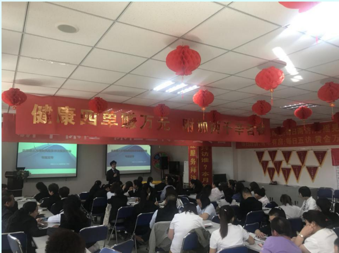
外勤非法集资专题培训

5月为非法集资宣传活动月。新华保险锡盟中支根据内蒙保监局及上级分公司工作要求，积极开展非法集资宣传活动。