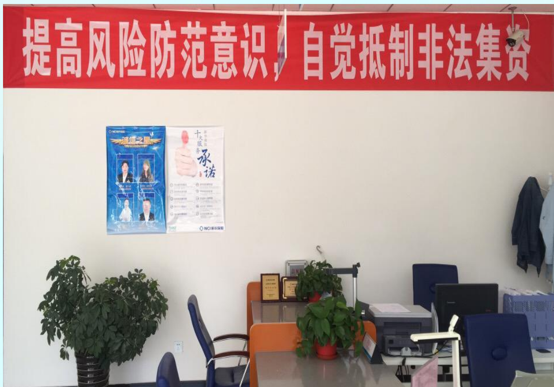
张贴非法集资宣传条幅