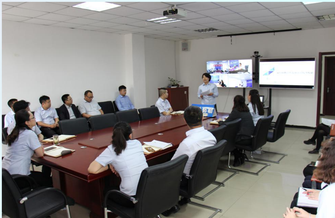
内勤非法集资专题培训