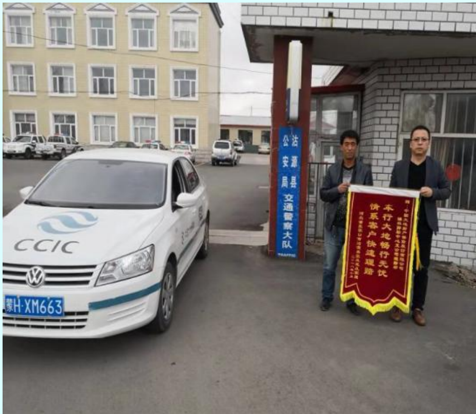
(图文/中国大地保险锡林郭勒中心支公司 蔡迪)