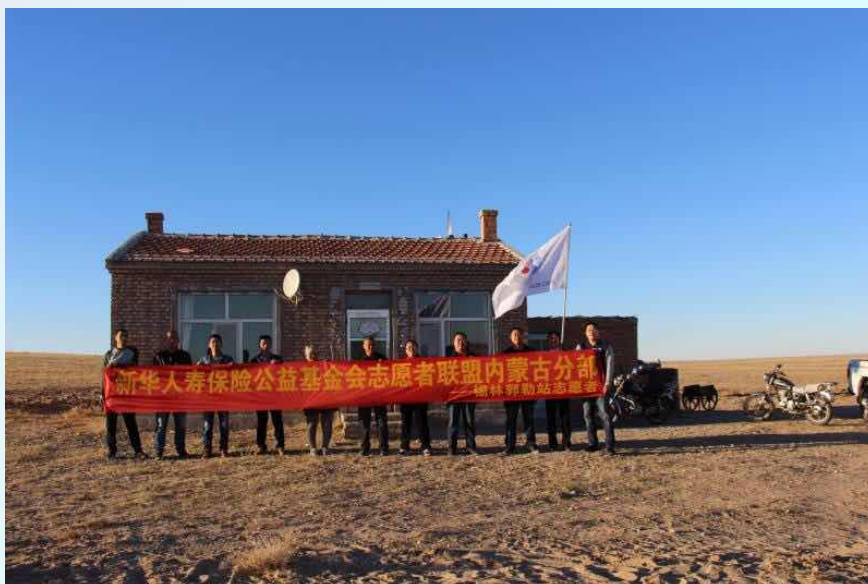
新华志愿者联盟“走进都希乌拉嘎查”