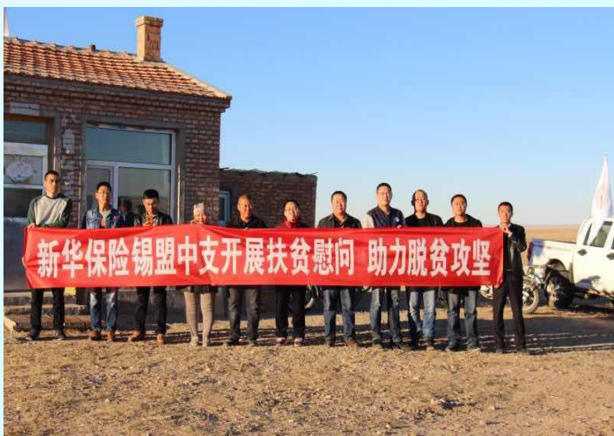
锡盟中支扶贫工作组

党的十九大提出要把“人民对美好生活的向往”作为奋斗目标。新华保险锡盟中支愿和全区保险业共同行动，时刻已守候人民美好生活为己任，为不断增强人民群众的获得感、幸福感、安全感而贡献绵薄之力。